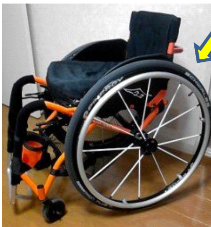
左側から見ると普通の車椅子